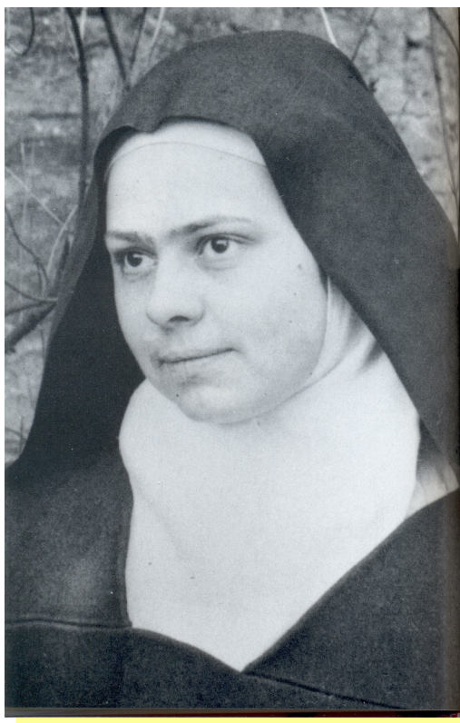
Élisabeth Catez, Szentháromságról nevezett Erzsébet nővér, dijoni kármelita (1880-1906)

2016. június 20-án, a Szentatya, Ferenc pápa bejelentette a Szentháromságról nevezett Boldog Erzsébet kármelita nővér szentté avatásának időpontját, mely 2016. október 16-án lesz, Rómában.